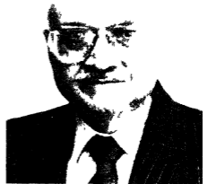
ममाजरत्न साह अशाककुमार जन